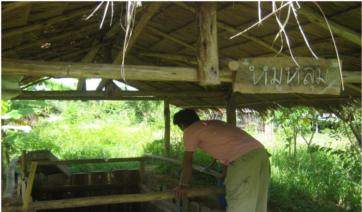
การทำหมูหลุม หมู่ที่ 10 บ้านท่ากะบาก ตำบลท่าแขก อำเภอเมืองสระแก้ว จังหวัดสระแก้ว