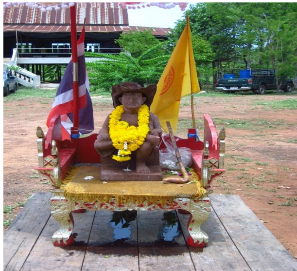
เจ้าพ่อหนองเตียน