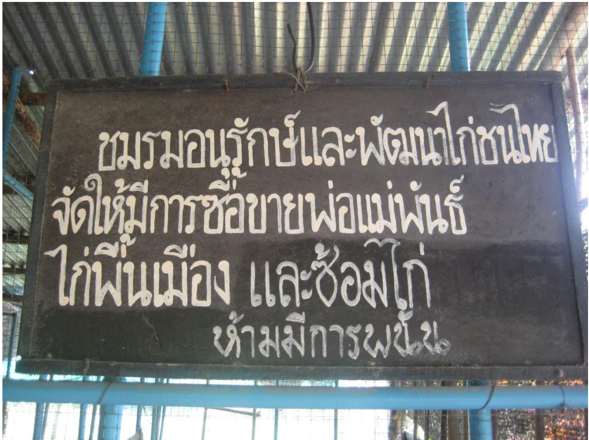
หมู่ที่ 12 บ้านกิโลสาม ตำบลท่าแขก อำเภอเมือง จังหวัดสระแก้ว