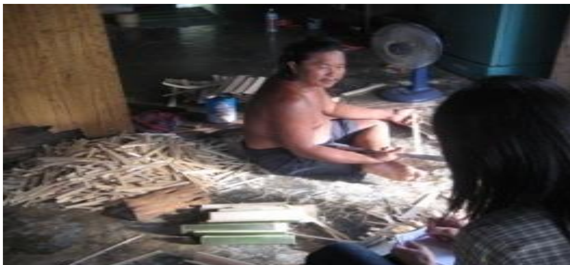
(การจักรสาน)